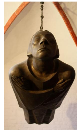
Der Schwebende im Güstrower Dom, Ernst Barlach, 1927